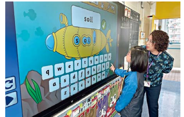
●外籍英語老師推展具趣味性的教學模式，為學生奠定堅實的語言基礎。