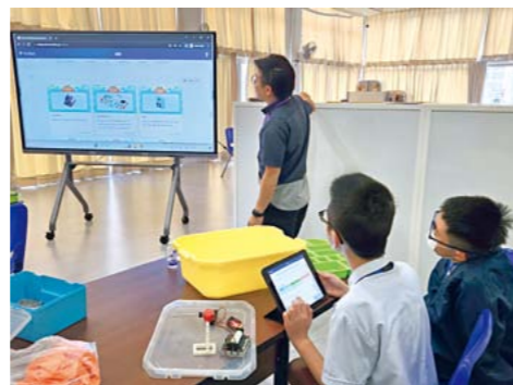
●學校把英語學習元素滲透在STEAM科創類課程中，促進學生的英語應用能力。

學校更將英語學習元素滲透在STEAM科創類課程中，提升學生的英語應用能力，如透過Metas積木工程師、kittenbot電子積木等科創課程，學生於學習編程的過程中，可學習、掌握及應用相關的英語知識。「學生亦可透過學習Scratch英語編程語言，以及編寫屬於自己的益智英語遊戲。在科學Gakken實驗課程中，學生更可在動手做實驗的過程中，學習科學範疇的英語用語，豐富英語詞彙，建立全面的知識聯繫，貫徹跨科學習理念。」陳校長說。